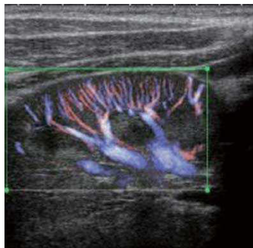
文責 生理機能検査科 西川副主任

これまでよりも微細な血流を分離して観察でき、腫瘍に流出入する血流の判別も容易になりました。是非ご利用ください。